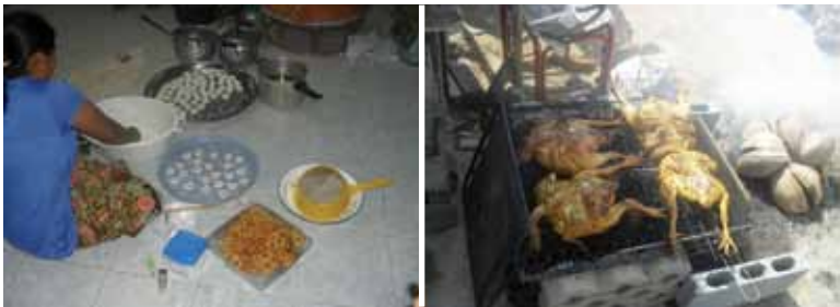
ไก่ย่าง และขนมประจำประเพณี ที่ผู้หญิงต้องเตรียมทั้งวัน ก่อนนำไปไหว้ในพิธีกรรมที่บาหลี