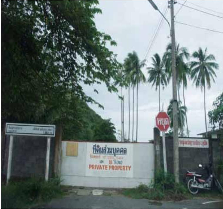
สุสานชุมชนแหลมตุ๊กแก (ลิเฮอร์) ทางเข้าถูกปิดกั้นอย่างหนาแน่น