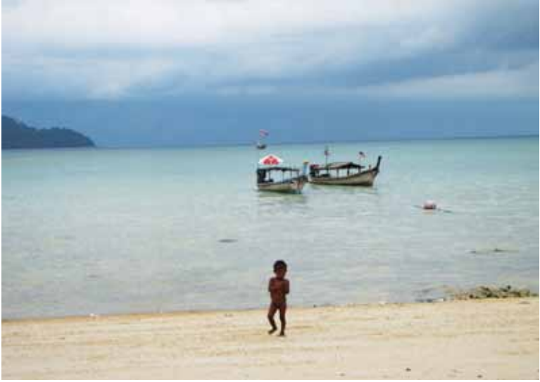
เด็กน้อยริมหาดเกาะสุรินทร์

เด็กๆ ที่กระโดดโลดเต้น และดำผุดดำว่ายอยู่ริมทะเล อาจไม่รู้สึกลึถึงความเปลี่ยนแปลงที่เกิดขึ้น แต่คนที่ผ่านคลื่นผ่านลมมาแล้ว 60 กว่าปีอย่างนาง ย่อมรับรู้ถึงสถานการณ์ร้ายรอบที่ส่งผลให้วิถีชนเผ่ามทรุด ขณะที่ชาวบ้านหลายคนเริ่มใจคอไม่ดี เพราะพิธีไหว้ผีบรรพบุรุษ ที่เรียกว่า “หล่อโบบง” ในปีนี้ยังไม่ได้ทำกันเลย เพราะปัจจัยภายนอกอีกเช่นกันที่ทำให้ชาวมอแกนต้องเป็นฝ่ายคอยและคอย