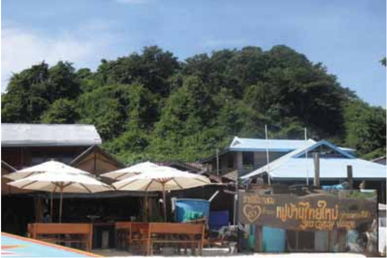
หมู่บ้านไทยใหม่หรือชุมชนชาวเลบ้านแหลมตง อยู่ระหว่างโรงแรมใหญ่ 2 โรงแรม

หมู่บ้านไทยใหม่หรือชุมชนชาวเลแหลมตงมีเนื้อที่ 2.3 ไร่ ตั้งอยู่ท่ามกลางรีสอร์ต โรงแรม ภัตตาคารหรูที่ผุดขึ้นเป็นดอกเห็ดนับ ตั้งแต่การท่องเที่ยวของไทยเติบโต ชุมชนชาวเลจึงกลายเป็นหมู่บ้านกลางดง ธุรกิจการท่องเที่ยว ทั้งที่ชาวเลกลุ่มนี้ตั้งรกรากอยู่บนผืนดินนี้มาก่อน กลุ่มคนภายนอกจะเข้ามา ชายหาดยาวจากเหนือจรดใต้กว่า 3 กิโลเมตร ชาวเลครอบครองอยู่อาศัย และทำมาหากินมาอย่างยาวนาน