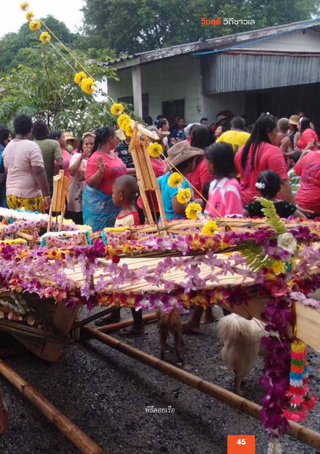
พิธีลอยเรือ