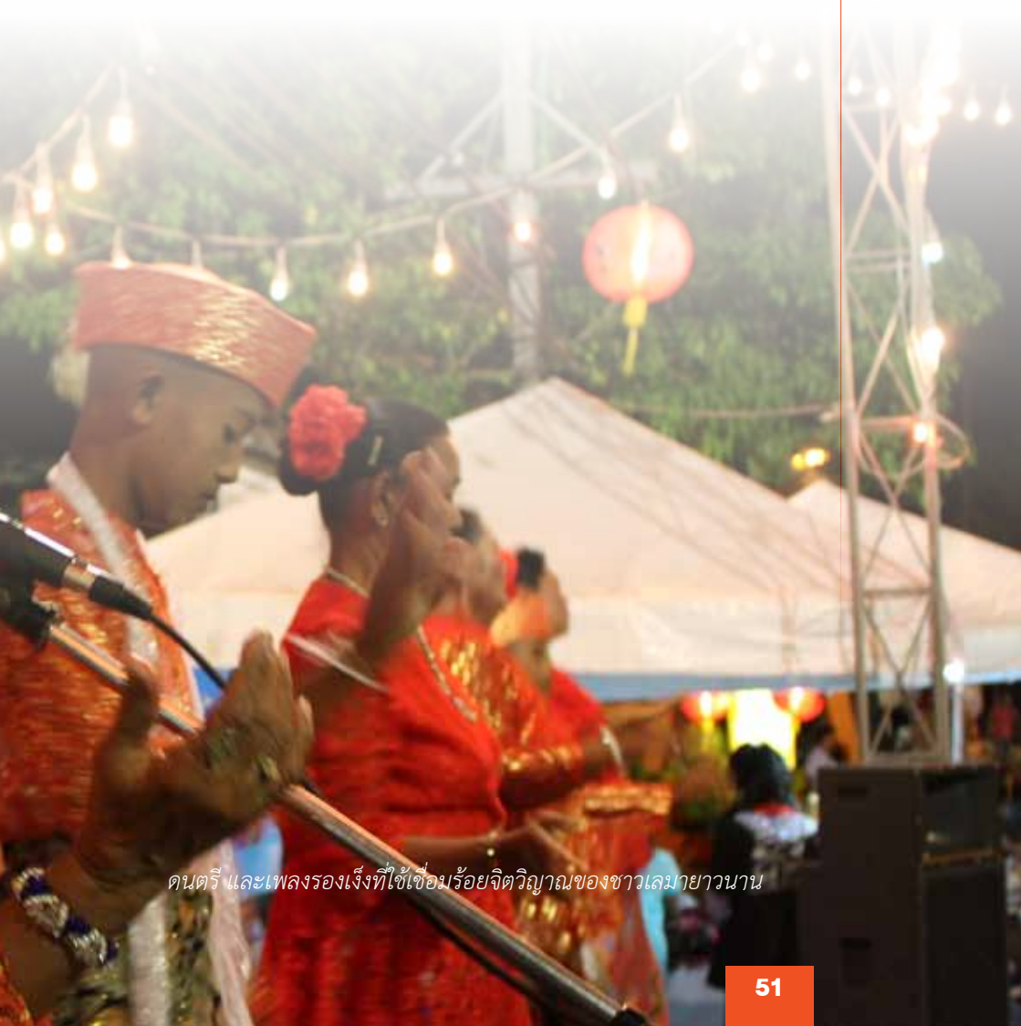
ดนตรี และเพลงร้องเสียงที่ใช้เชื่อมร้อยจิตวิญญาณของชาวเลมายาวนาน

เพื่อการเดินไปมาระหว่างบ้านกับสุสานทำได้สะดวก บางสุสานอยู่บนเนินเขา บางสุสานอยู่ไกลออกไปจากชุมชน และชายหาด สำหรับชาวเลแล้วพื้นที่สุสาน คือ วิญญาณอันสงบของบรรพบุรุษที่ลูกหลานเฝ้าเวียนวนให้ปกปักรักษาคุ้มครอง และสัมพันธ์กับจิตใจอย่างแยกออกจากกันไม่ได้มูลค่าไม่ได้ถูกประเมินตั้งเช่นกลุ่มบุคคลภายนอกมองเห็นค่าเม็ดเงินจากทำเลอันเหมาะสมในการทำสิ่งก่อสร้างด้านการท่องเที่ยว