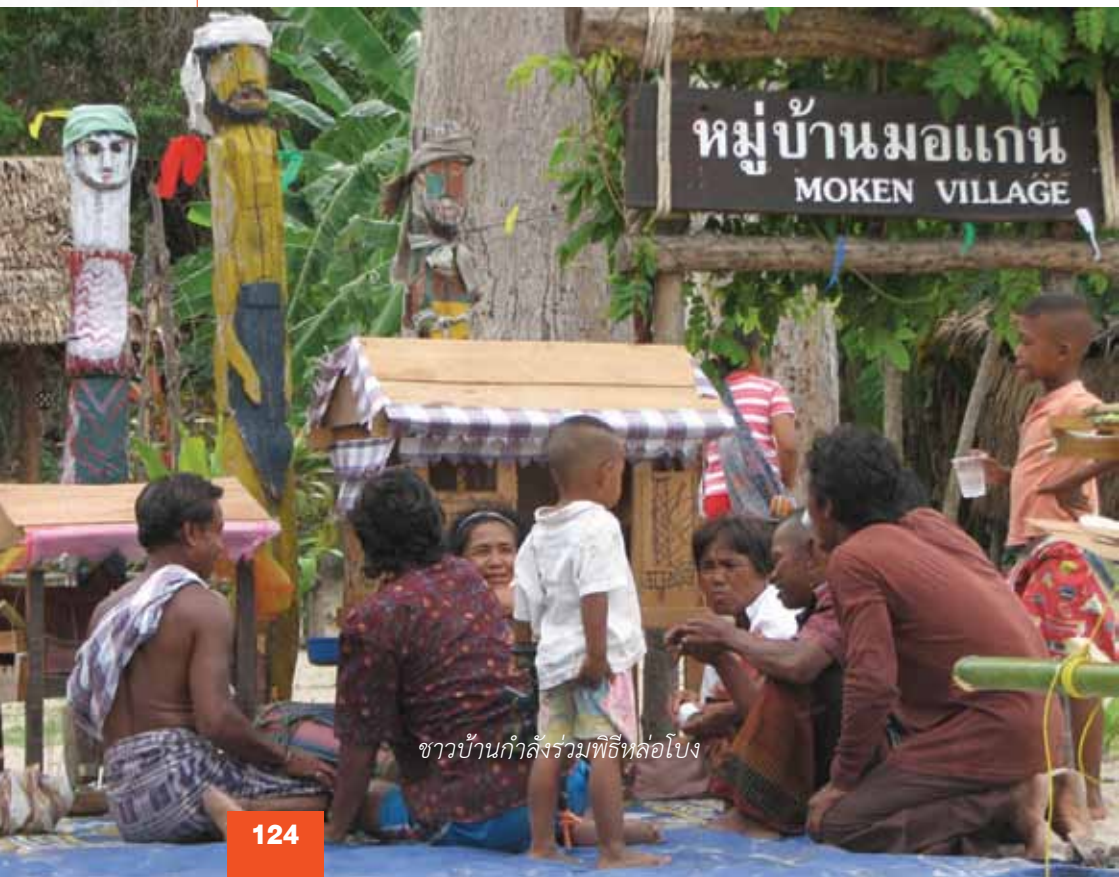
ชาวบ้านกำลังร่วมพิธีหล่อโอง