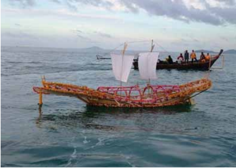
พิธีลอยเรือของชุมชนชาวเลลิเฮอร์

กลุ่มชาติพันธุ์ชาวเล มีปัญหาเหมือนกับชนเผ่าพื้นเมืองในพื้นที่อื่นๆ ของประเทศไทย กล่าวคือได้รับผลพวงจากการพัฒนาสมัยใหม่ที่ไม่สมดุล ส่งผลกระทบต่อชนกลุ่มน้อย