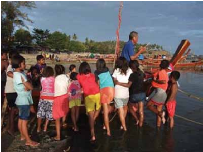
พิธีไหว้เรือ

ชาวเลทั้งสามกลุ่ม มีวิถีทางวัฒนธรรม การแสดง และพิธีกรรมที่แตกต่างหลากหลาย และน่าสนใจ อาทิเช่น พิธีไหว้หลาพ้อตาหรือโต๊ะตามความเชื่อของแต่ละพื้นที่ พิธีนอนหาด พิธีลอยเรือ พิธีอาบน้ำมนต์ งานกินข้าวกลางบ้าน การแสดงร้องเง็ง และกาหยง ฯลฯ