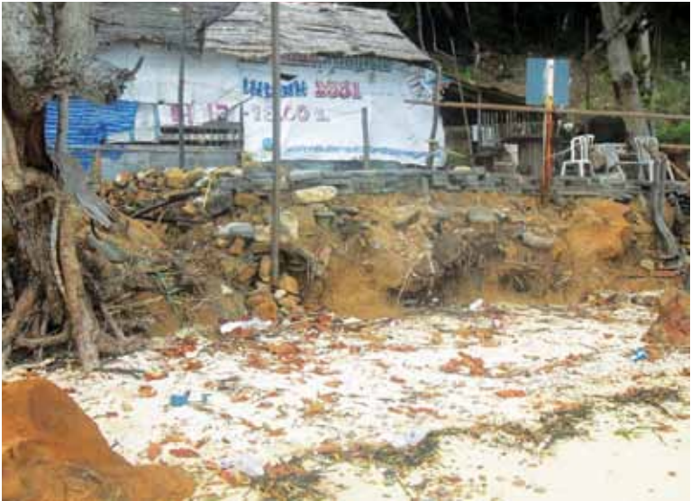
บ้านที่เริ่มสร้างรูกล้าสุสาน

ปัจจุบันชาวเลใช้สุสานอยู่ที่อ่าวผี (เนื้อที่ไม่ถึงไร่) มีคนมากันรั้ว ลวดหนาม มีบ้านคนต่างถิ่น 1 หลัง และมีถนนตัดผ่ากลางสุสาน