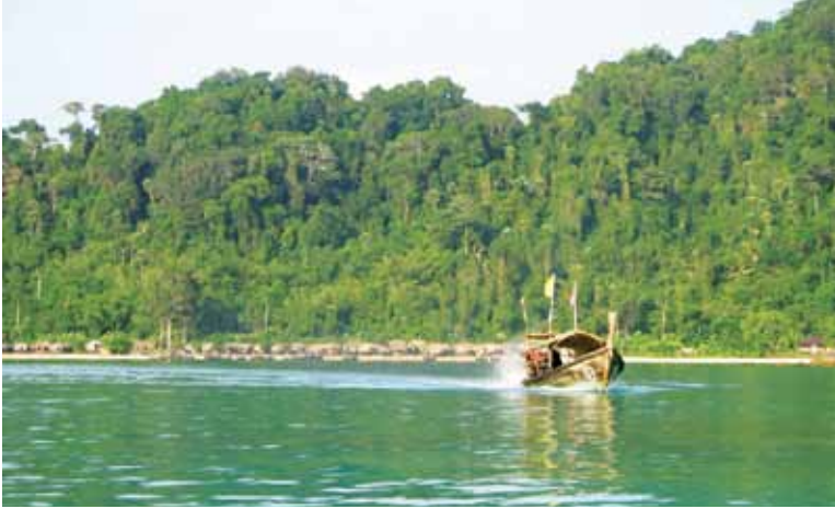
หมู่บ้านชาวเลบนหมู่เกาะสุรินทร์

ยามสายของวันรุ่งขึ้น แสงระยิบระยับกำลังส่องสะท้อนผืนน้ำสีเขียวอมคราม ชาวบ้านช่วยกันนำเรือกำบังลำน้อยที่สร้างขึ้นตั้งแต่สองวันก่อนไปลอยในกลางทะเลลึก