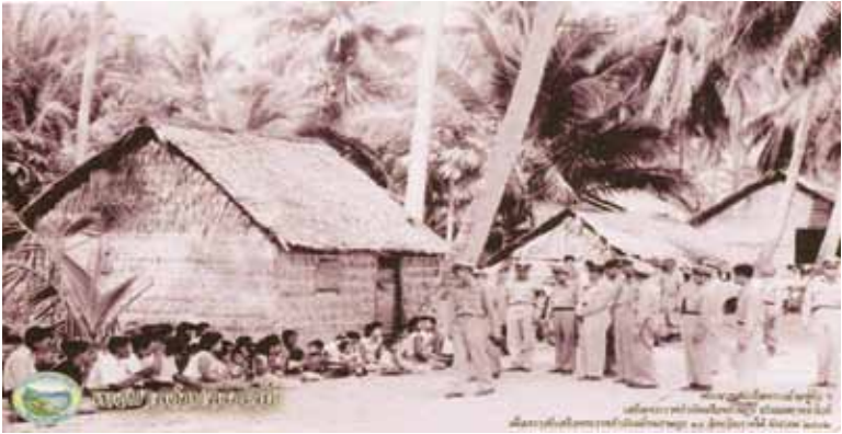
ปี 2502 ในหลวงเสด็จเยี่ยมชาวเล บ้านราไวย้อ

จาริกเล่าว่า “พวกเราชาวเลเราไวย้อาศัยอยู่ในที่ดินผืนนี้มากกว่า 300 ปี ช่วงเวลาหนึ่งที่มีคนอาศัยอยู่กันเป็นชุมชน มีลูกเต็มบ้านหลานเต็มเมือง แต่แล้วปี 2508 ก็มีการออกโฉนดที่ดินทับที่ดินชาวบ้านครึ่งชุมชน ผ่านมาอีกระยะเวลาหนึ่ง ปี 2516 ก็มีการออกโฉนดเพิ่มอีก แปลงครอบคลุมทั้งชุมชน ก่อนหน้านั้น ปี 2502 พระเจ้าอยู่หัวเสด็จลงมาเยี่ยมชุมชนเรา พวกเราดีใจมากเลย พวกเราอยู่มาก่อนตั้งนาน เราไม่เคยรู้เลยว่าเอกสารไปเที่ยวทั้งที่ไม่เคยมาอยู่ในนี้เลย จะถือว่าเป็นเจ้าของ เราเข้าใจว่าคนไทยจะอยู่ที่ไหนก็ได้ เมื่ออยู่แล้วก็น่าจะเป็นเจ้าของที่ดินด้วย”