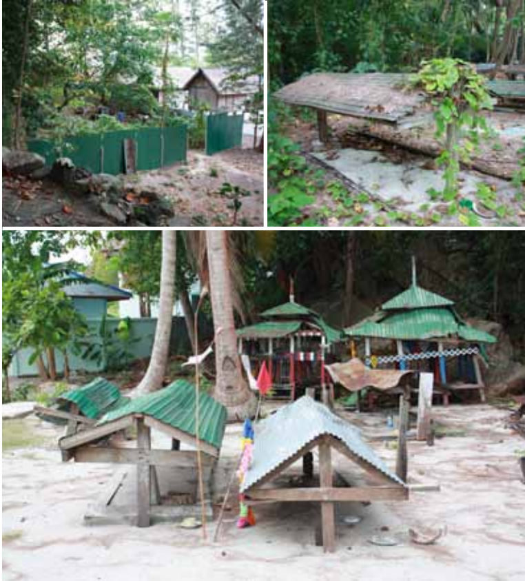
ริสอร์ทติดกับรั้วสุสาน

เป็นสุสานดั้งเดิม ชาวเลไม่มีข้อมูลว่าสุสานมีพื้นที่เท่าไร และ ไม่แน่ใจว่ามีใครออกเอกสารสิทธิ์ทับพื้นที่สุสานหรือไม่ คำบอกเล่าของ ชาวเล บอกว่าตรงนี้เขาจะไม่ให้ฝังศพแล้ว