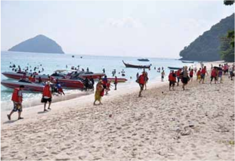
เกาะเฮ...วันนี้ เป็นแหล่งท่องเที่ยว

หาหลักฐานการตั้งรกรากเดิมสู่เอาที่ดินคินจากนายทุน : ปัจจุบัน การค้นหาความเป็นมาของชุมชนอุรักราไวย์ โดยเยาวชนรุ่นใหม่ ทำให้พบหลักฐานที่น่าสนใจหลายอย่าง เช่น มีการบันทึกไว้ว่า มีกลุ่มชาวเลอาศัยอยู่ในพื้นที่นี้ตั้งแต่ช่วงยุคหิน (3,000 ปี) จนกระทั่งประมาณช่วงรัชกาลที่ 3 ที่มีกฎหมายกำหนดให้กลุ่มชาวเลที่เร่ร่อนอยู่ต้องขึ้นมาอยู่บนฝั่งที่ทำให้เกิดการตั้งถิ่นฐานที่แน่นอน โดยอพยพจากบริเวณเกาะเฮและย้ายมาอยู่บริเวณหาดราไวย์ เมื่อประมาณ 100 กว่าปีแล้ว ดำรงชีพด้วยการออกทะเลหาปลา ปลูกต้นมะพร้าวบ้านยกสูงพื้นปูด้วยฟากไม้ไผ่ ฝาบ้านใช้ไม้ไผ่หลังคามุงด้วยจากมะพร้าว ใช้เปลือกต้นเสม็ดแช่น้ำมันยางจุดไฟ ออกทะเลหาปลา หรือทำไร่