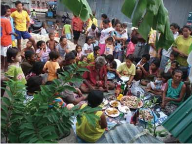
พิธีหล่อโอง ชุมชนชาวเลราไวย์ จังหวัดภูเก็ต

ปัจจุบันมีชุมชนชาวเล 41 ชุมชน จำนวน 2,758 ครัวเรือน มีประชากรประมาณ 12,000 คน กระจายใน 5 จังหวัดอันดามัน คือ ภูเก็ต 5 ชุมชน พังงา 20 ชุมชน ระนอง 3 ชุมชน กระบี่ 10 ชุมชน และสตูล 3 ชุมชน