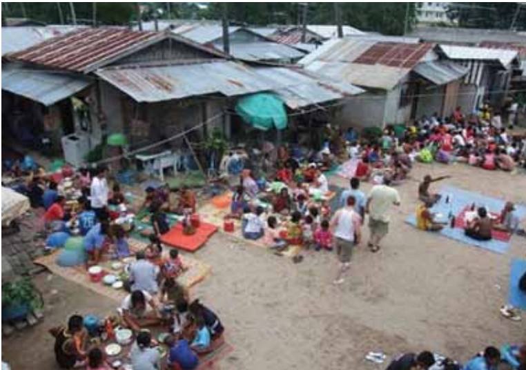
งานกินข้าวกลางบ้านชาวเลราไวย์ จังหวัดภูเก็ต ปัจจุบันมีเอกชนอ้างสิทธิ์ในที่ดินโดยออกเอกสารสิทธิ์ที่ดินทับชุมชน และฟ้องขับไล่ชาวเลกลุ่มนี้

การขาดกรรมสิทธิ์ที่ดินส่งผลกระทบต่อความมั่นคง และสวัสดิการอื่นๆ เช่น ต้องใช้น้ำประปาไฟฟ้า ราคาแพงกว่าคนทั่วไป 2 ถึง 3 เท่าเพราะซื้อแบบต่อฟ่วง ขาดโอกาสที่จะได้รับการพัฒนาจากหน่วยงานท้องถิ่น เช่น ชุมชนราไวย์ บ้านบางหลังต้องใช้เทียน/ตะเกียง ต้องใช้น้ำบ่อ ไม่มีห้องน้ำ ไม่มีที่ระบายน้ำ ฯลฯ