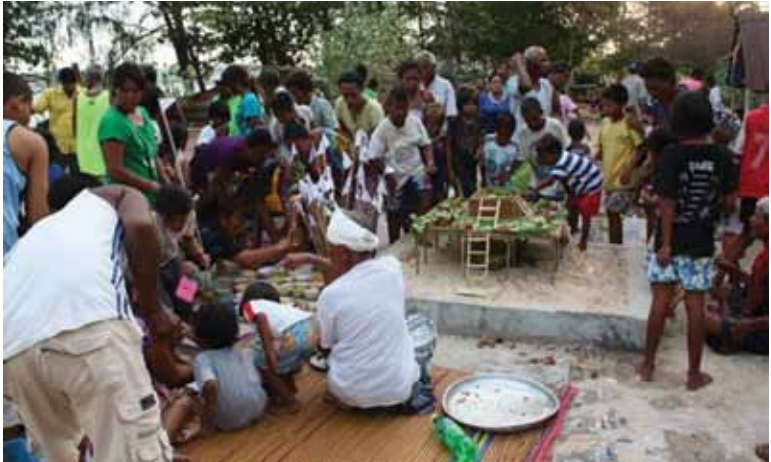
พิธีไหว้บ่าลัยชุมชนชาวเลบ้านราไวย์ จังหวัดภูเก็ต

เข้าไปหากินในที่ทำกินดั้งเดิมที่เคยหากินมาตั้งแต่บรรพบุรุษ ทั้งๆ ที่รัฐธรรมนูญไทยรับรองสิทธิตามจารีตประเพณีดั้งเดิม แต่ไม่มีผลในทางปฏิบัติ ส่งผลให้คุณภาพชีวิตของชาวเลตกต่ำลงเรื่อยๆ ชาวเลจึงเป็นเสมือนพลเมืองชั้นสองของประเทศไทย