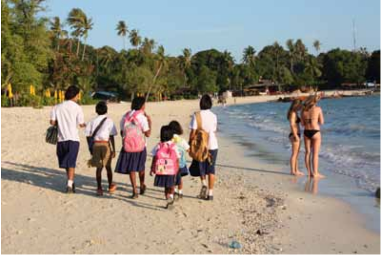
นักเรียนโรงเรียนแหลมตงในเกาะพีพีเดินทางไปโรงเรียน

ปัจจุบันชาวชุมชนแหลมตงเข้าร่วมขบวนการต่อสู้เพื่อความเป็นธรรมของกลุ่มชาติพันธุ์ชาวเล ซึ่งเป็นกลุ่มด้อยโอกาส และถูกเบียดขับจากนโยบายการพัฒนาของรัฐ ที่ปรากฏปัญหาให้เห็นอย่างชัดเจนทุกวันนี้ ด้วยการเข้าร่วมกับ “เครือข่ายกลุ่มชาติพันธุ์ชาวเลในอันดามัน” และชนเผ่าพื้นเมืองอื่นๆ ทั่วประเทศ เพื่อเรียกร้องความเป็นธรรมให้กับกลุ่มชาติพันธุ์ชาวเลให้เป็นจริงขึ้นมา เพื่อให้สิทธิความเป็นพลเมืองไทยปรากฏชัดเจนเป็นรูปธรรมมากกว่าข้อสัญญาในแผ่นกระดาษ