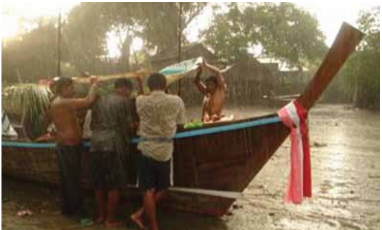
พิธีไหว้เรือบ้านหินลูกเดียว จังหวัดภูเก็ต