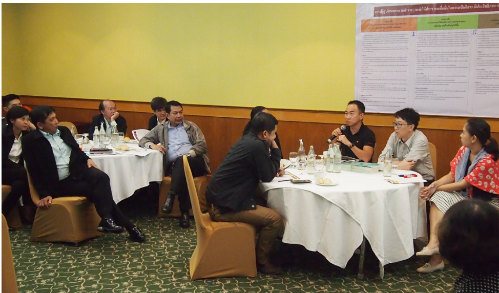
การสนทนาทางออก วันเสาร์ที่ 19 กันยายน 2558 ณ โรงแรมดวงตะวัน จ.เชียงใหม่