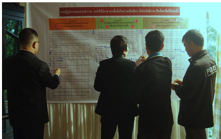
การประชุมกลุ่มย่อย วันเสาร์ที่ 31 ตุลาคม 2558 ณ โรงแรมดุสิตธานี กรุงเทพฯ