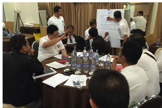
การสัมมนา “การแยกงานสอบสวนออกจากสำนักงานตำรวจแห่งชาติ” วันเสาร์ที่ 12 ธันวาคม 2558 โดยสหพันธ์พนักงานสอบสวน