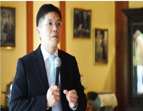
การสนทนาทางออก วันเสาร์ที่ 4 กรกฎาคม 2558 ณ โรงแรมดุสิตธานี กรุงเทพฯ

- จัดให้มีการพัฒนาศักยภาพเจ้าหน้าที่งานสอบสวนให้เท่าทันสถานการณ์และความรู้ที่เปลี่ยนแปลงไปอย่างสม่ำเสมอ โดยเฉพาะอย่างยิ่งการพัฒนาพนักงานสอบสวนให้มีความเชี่ยวชาญเฉพาะทางสำหรับคดีสำคัญหรือคดีพิเศษ อาทิเช่น คดียาเสพติด คดีทางเพศ คดีอาชญากรรมข้ามชาติ ฯลฯ