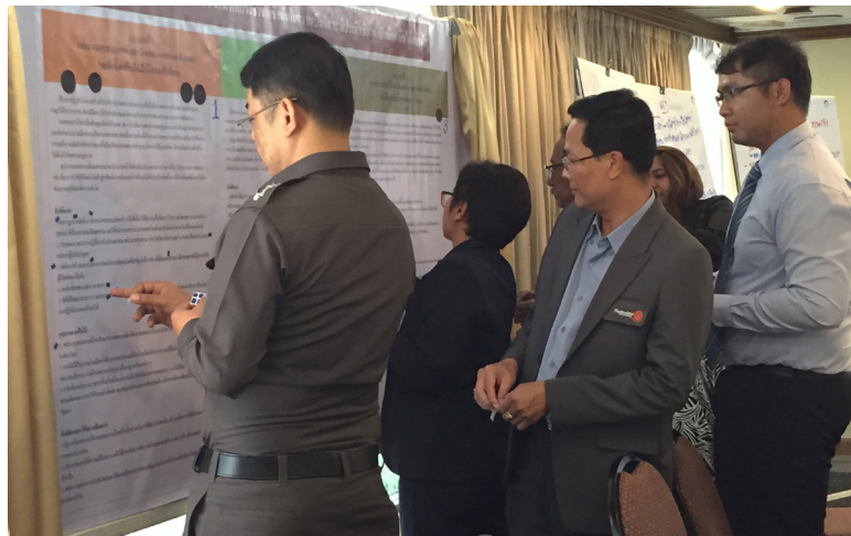
การสนทนาทางออก วันเสาร์ที่ 14 พฤศจิกายน 2558 โรงแรมสิมารามี่ จ.นครราชสีมา

ส่วนผลรวมความคิดเห็นของผู้เข้าร่วมประชุมหลังการแลกเปลี่ยนความคิดเห็น พบว่า แนวทางที่ 1 ได้รับความเลือกมากที่สุด แนวทางที่ 3 และ 2 ได้รับความเลือกเป็นลำดับต่อมา และส่วนใหญ่เป็นไปในทิศทางเดียวกัน ยกเว้นพื้นที่กรุงเทพมหานคร กล่าวคือ เวทีที่จัดขึ้นในภูมิภาค (การสนทนาทางออกครั้งที่ 4 ครั้งที่ 5 และครั้งที่ 7) ผู้เข้าร่วมประชุมส่วนใหญ่เห็นด้วยกับ แนวทางที่ 1 ส่วนเวทีที่กรุงเทพมหานคร (การประชุมกลุ่มย่อยครั้งที่ 6) ซึ่งมีการกระจายตัวของคะแนนค่อนข้างใกล้เคียงกันให้การสนับสนุนแนวทางที่ 2 มากกว่าเล็กน้อย