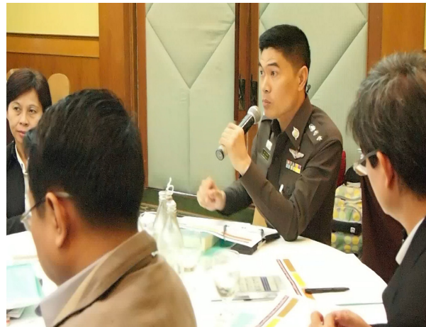
การสนทนาทางออก วันเสาร์ที่ 22 สิงหาคม 2558 ณ โรงแรมดวงตะวัน จ.เชียงใหม่