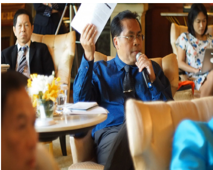
การประชุมกลุ่มย่อย วันเสาร์ที่ 4 กรกฎาคม 2558 ณ โรงแรมดุสิตธานี กรุงเทพฯ