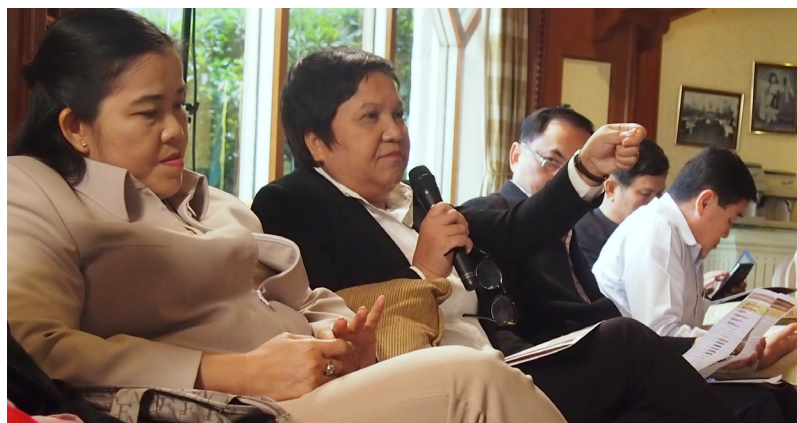
การประชุมกลุ่มย่อย วันเสาร์ที่ 31 ตุลาคม 2558 ณ โรงแรมดุสิตธานี กรุงเทพฯ