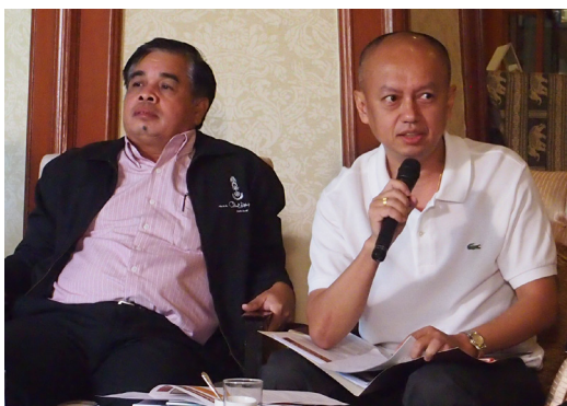
การประชุมกลุ่มย่อย วันเสาร์ที่ 31 ตุลาคม 2558 ณ โรงแรมดุสิตธานี กรุงเทพฯ